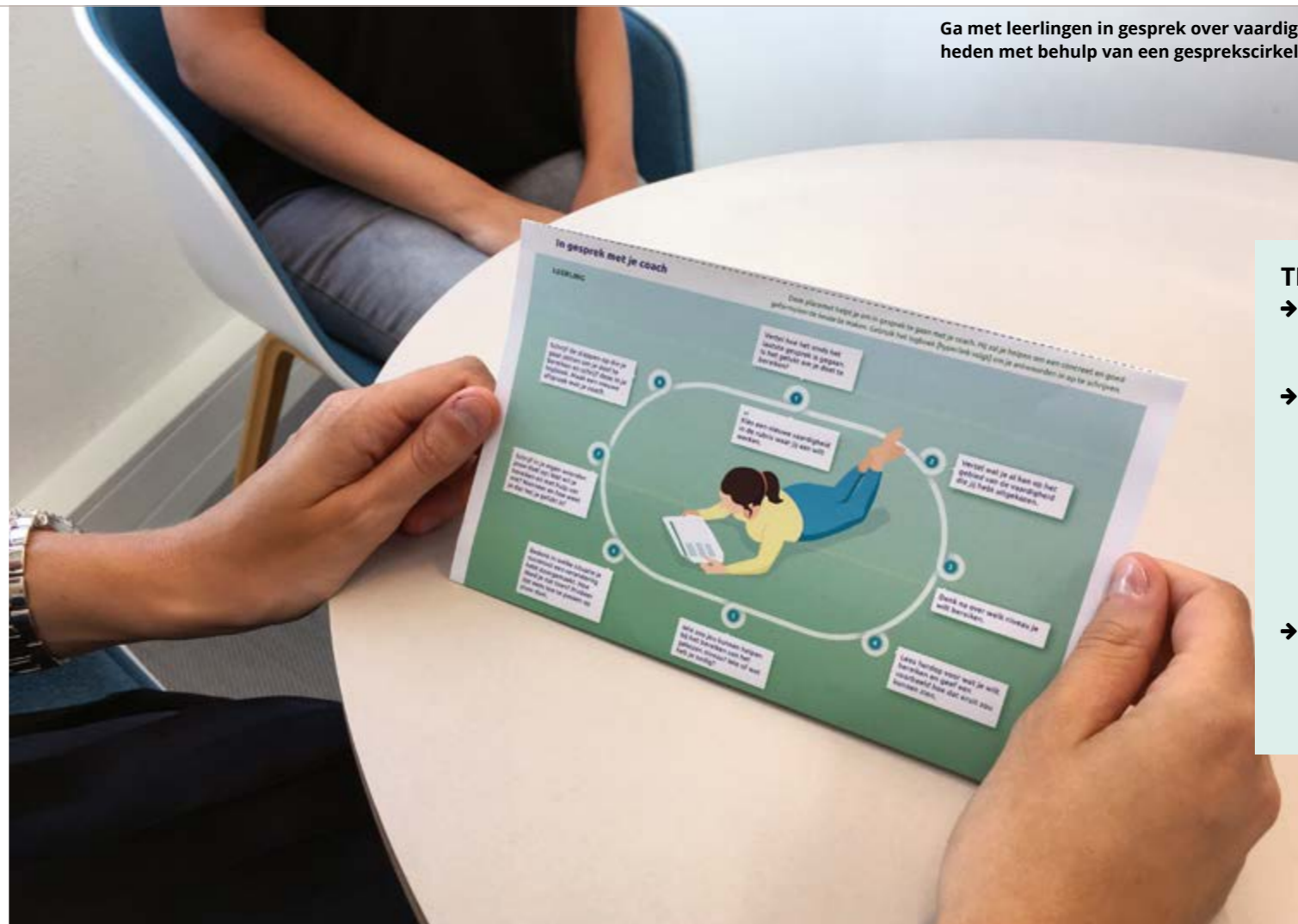
Ga met leerlingen in gesprek over vaardigheden met behulp van een gesprekscirkel.

Het leerlab Veranderende rol van de docent en leerling maakte vaardighedenrubrics voor leerlingen, docenten en begeleiders om onderwijs op afstand mogelijk te maken. Om het coachingsgesprek met leerlingen hierover aan te gaan gebruiken ze een 'placemat'.