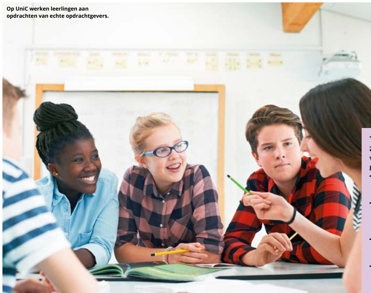
Op UniC werken leerlingen aan opdrachten van echte opdrachtgevers.

omschreven. De opdracht voor de challenge duurzaamheid luidde bijvoorbeeld: bedenk een innovatief idee om de waterspiegelstijging tegen te gaan. In de vijfde en zesde klassen krijgen leerlingen steeds meer vrijheid om de opdracht zelf in te vullen.