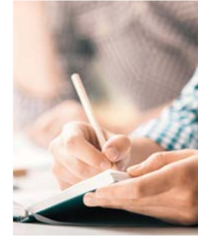
22 "Dankzij het logboek zijn we veel meer over doelen gaan praten"