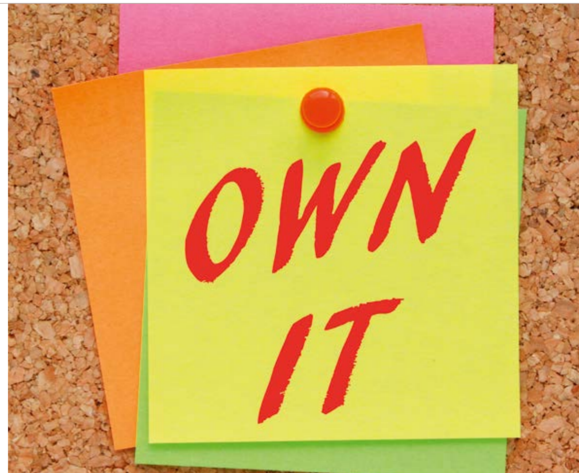
Het Stedelijk College Eindhoven zet eigenaarschap voor zowel leerling als docent centraal.

Het Stedelijk heeft eerst een visie bedacht en is toen gaan bedenken hoe ze dit in de praktijk konden brengen. Het vergroten van de keuzevrijheid van leerlingen betekende dat docenten hun manier van onderwijzen ook anders gingen aanpakken. Theo: “In het hele proces zoekt ieder zijn rol. Dit is soms best lastig. Maar uiteindelijk moet iedereen mee in deze ontwikkeling. Ik denk dat alle docenten zich de vraag moeten stellen: ‘Leid ik kinderen op voor hun toekomst of voor mijn verleden?’ We doen het voor de kinderen, dat zijn de winnaars van morgen.” ●