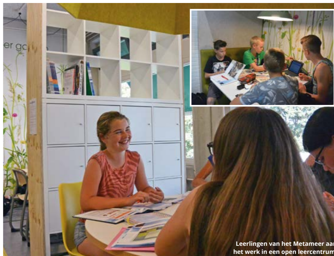
Leerlingen van het Metameer aan het werk in een open leercentrum.