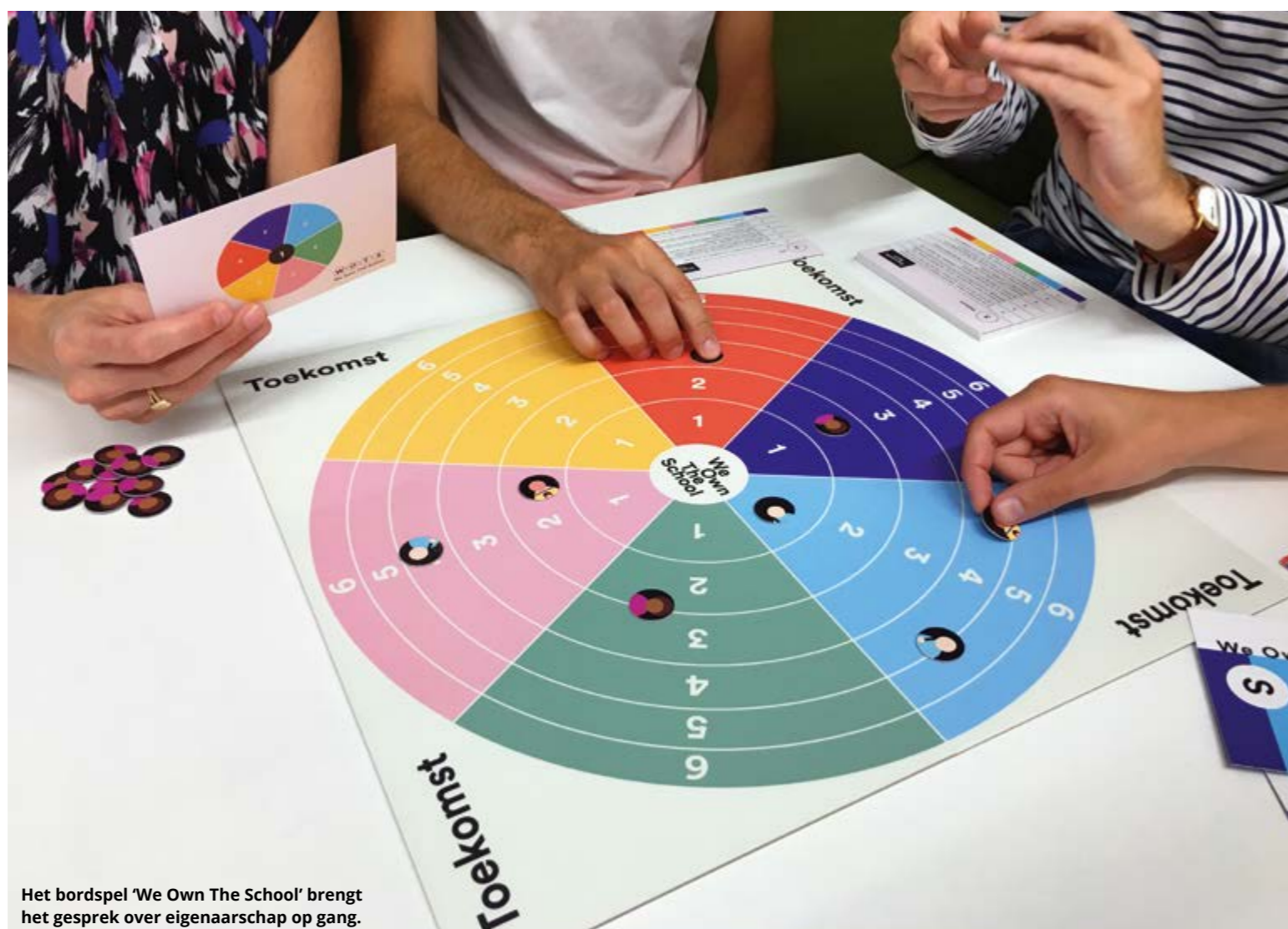
Het bordspel 'We Own The School' brengt het gesprek over eigenaarschap op gang.

"IK WIL HET WEL MET MIJN KLAS SPELEN. OMDAT HET EEN LAAGDREMPELIGE MANIER IS OM MEE TE DENKEN ALS LEERLING"