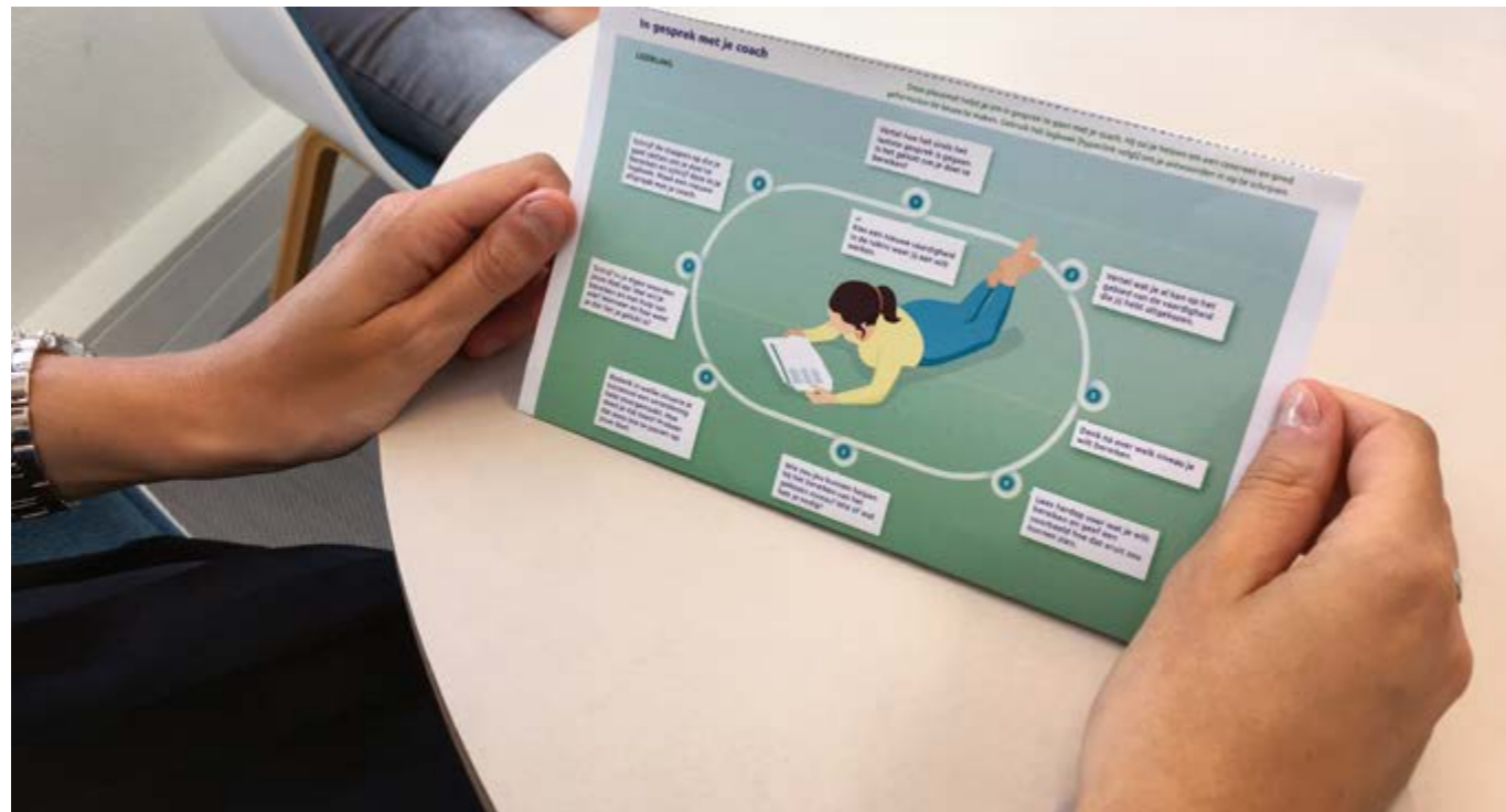
14 Een 'placemat' voor het coachingsgesprek