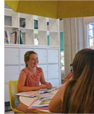
20 Tips voor de inrichting van een open leercentrum