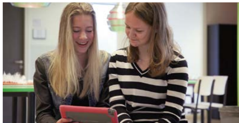
Leerlingen produceren tweewekelijks een schooljournaal met behulp van de scrummethode.