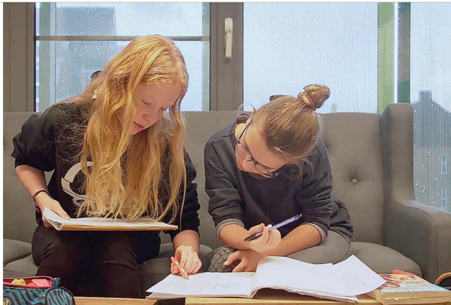
Het Fioretti College Lisse startte met een pilot gepersonaliseerd leren.

Het Fioretti College Lisse startte twee jaar geleden met een pilot gepersonaliseerd leren. Wat vinden leerlingen en ouders hiervan? “Ik vind het fijn dat je in je eigen tempo kunt werken.”