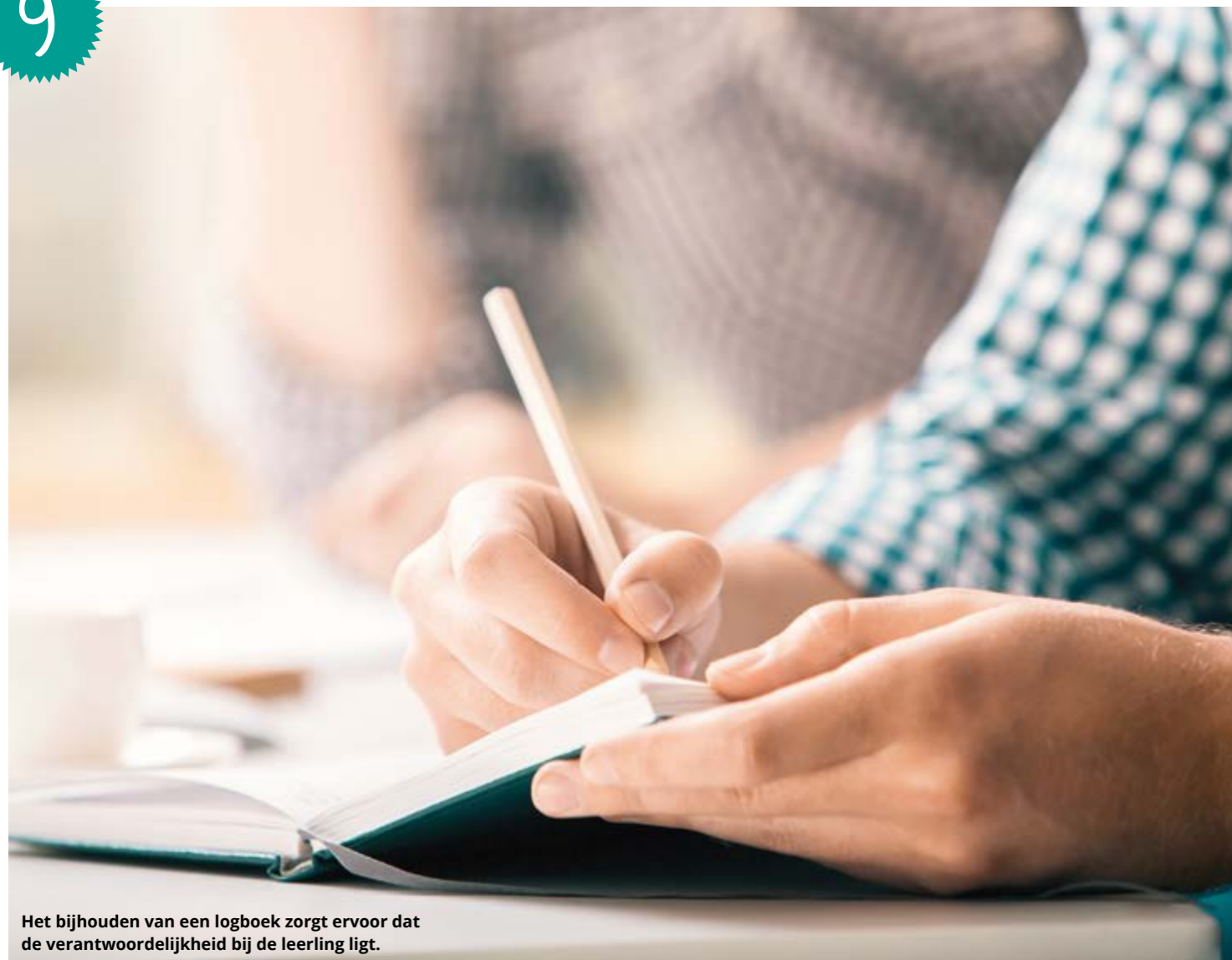
Het bijhouden van een logboek zorgt ervoor dat de verantwoordelijkheid bij de leerling ligt.

“DANKZIJ HET LOGBOEK ZIJN WE VEEL MEER OVER DOELEN GAAN PRATEN”