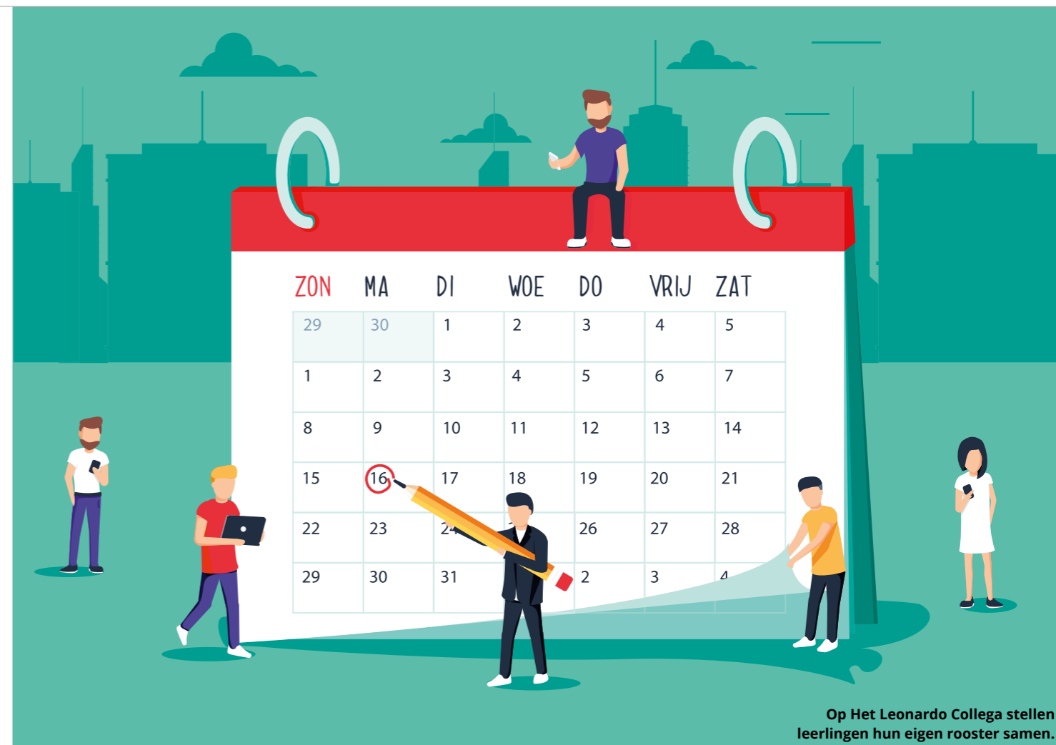
Op Het Leonardo College stellen leerlingen hun eigen rooster samen.