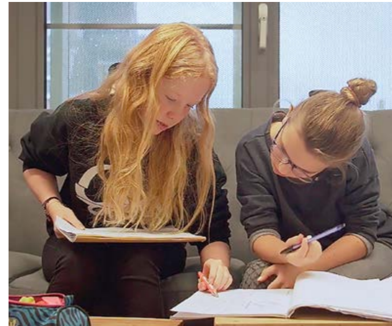
24 Leren van successen en van fouten