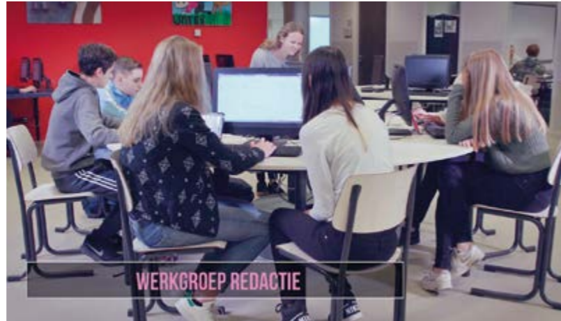
10 Scrum in de klas