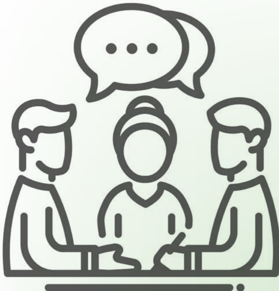
Een persoonlijk ontwikkelingsgesprek tussen leerling, ouder en coach.

Leerlingen SportLifeStyle van OSG Sevenwolden gaan tweemaal per jaar met hun coach en hun ouders in gesprek over hun ontwikkeling. Hoe zet je zo iets op? “Als we op perfectie gaan wachten, gaat de snelheid eruit.”