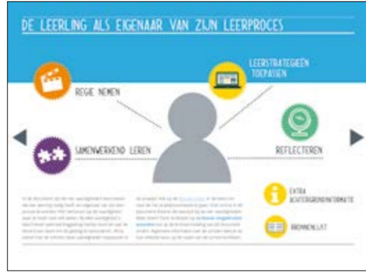
4 Whitepaper: Alles over eigenaarschap