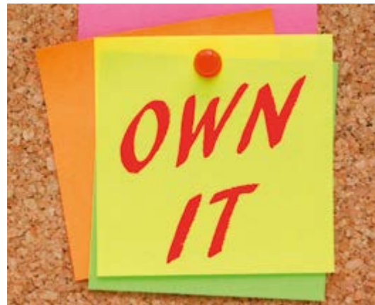
6 "Leid je kinderen op voor hun toekomst of voor jouw verleden?"